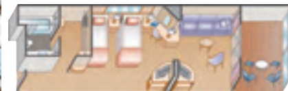
※3・4人利用時イメージ