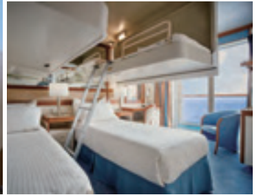
※3・4人利用時イメージ